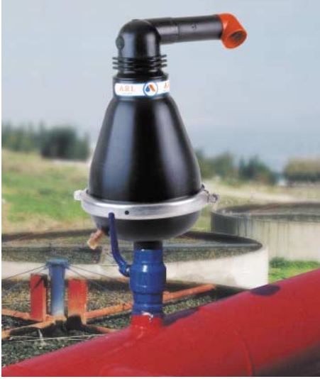
Instalación de un D-025 en una planta de tratamiento de alcantarillado

obstrucciones (de sal y otras materias). Los sólidos y/o suciedad amontonada se concentran en los sellos y al mecanismo de sellado, y son capaces de causar derrames y otros daños.