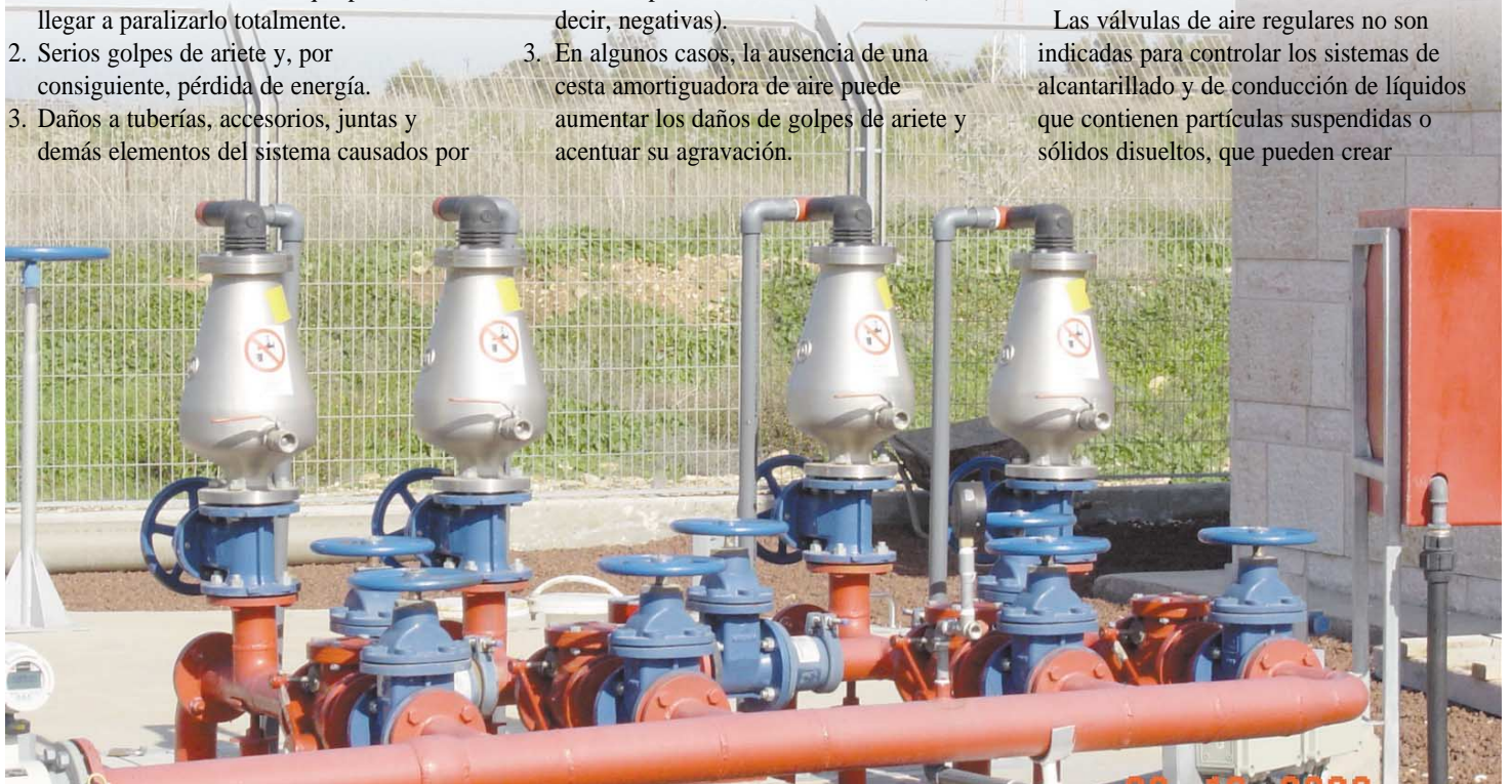
Proyecto de la estación de bombeo de alcantarillado "Hefer"

Las válvulas de aire regulares no son indicadas para controlar los sistemas de alcantarillado y de conducción de líquidos que contienen partículas suspendidas o sólidos disueltos, que pueden crear