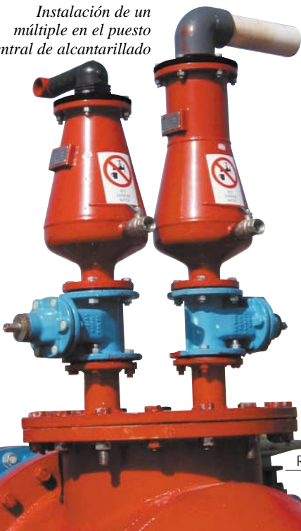
Instalación de un múltiple en el puesto central de alcantarillado

A continuación se detallan algunos de los modos como la válvula de combinación para aguas residuales MODELO D-020 de A.R.I., que soluciona los problemas surgidos en una válvula tradicional instalada en el alcantarillado: